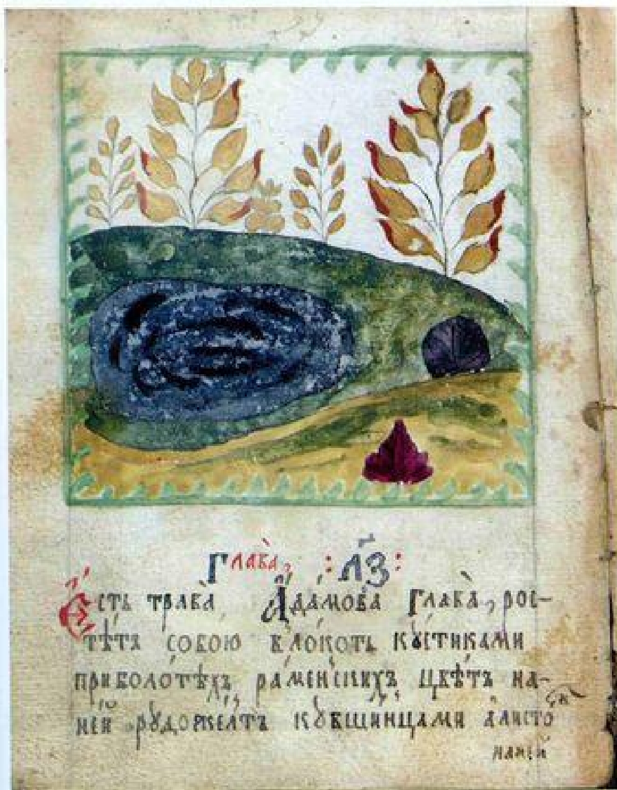
Илл. 1. РГБ. Усов. 26, л. 19 об., № 37, адамова глава (адамова глава 1).

Иллюстрации към статията на Александра Б. Имполитова „Растения с названием Адамова глава в русских рукописных травниках“, стр. 50–75.